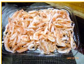
釜揚げサクラエビ